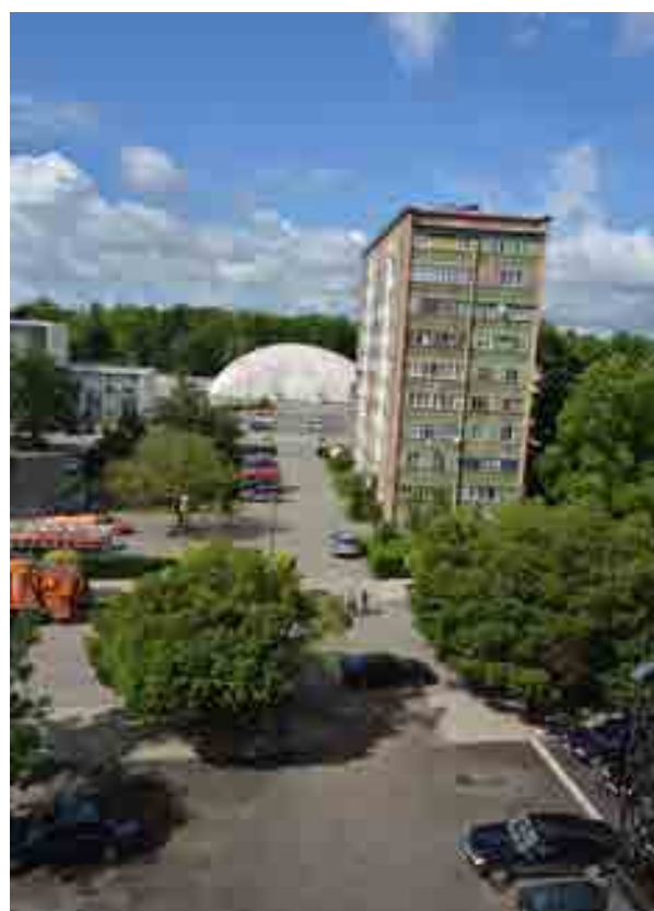
საქართველოს მწვანეთა მოძრაობა / დედამიწის მეგობრები საქართველო