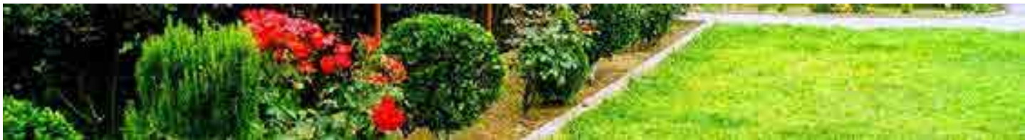
ნომინაცია ლამაზი ეზო